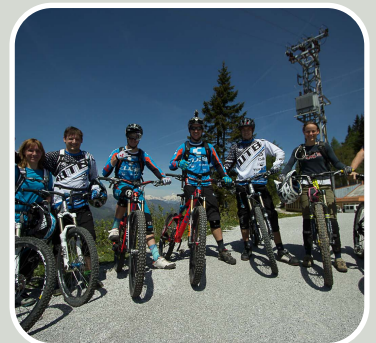
Sur les Hauteurs de Cerkno